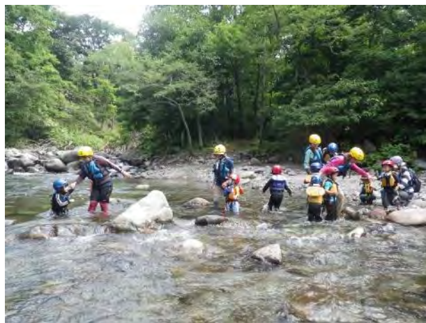
滝ノ沢方面へは川を渡ります

施設から一番近い川遊びのできる場所です。2つの川の合流地点で、流量が多い場所で流れたり、浮かんだりして遊ぶことができます。流れの少ない浅瀬もあり、のんびりとした川遊びも楽しめます。