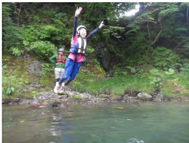
少し下流に飛び込める水たまりがある