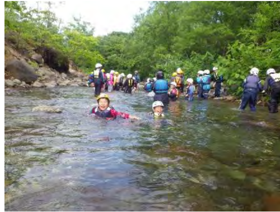
中洲を拠点に活動