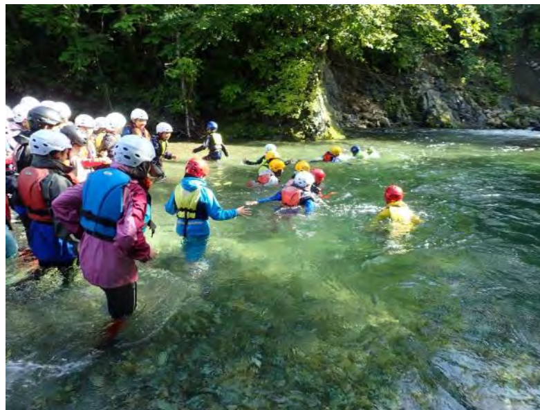
大きなプール状の川