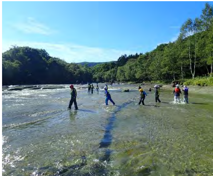
見通しのきく広い川幅