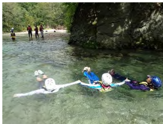
緩やかな流れが気持ちいい