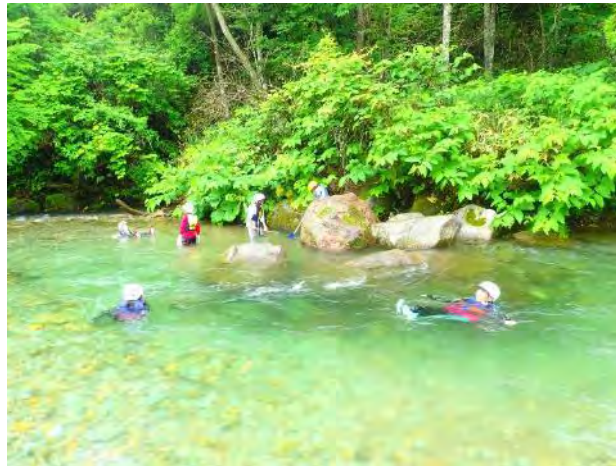
深さのある場所で流れて遊ぶ