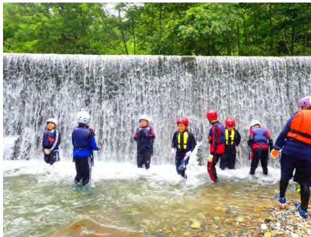
砂防での滝打たせ