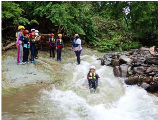
天然のウォータースライダー