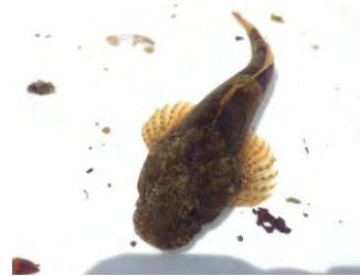
浅瀬で水辺の生きものさがし