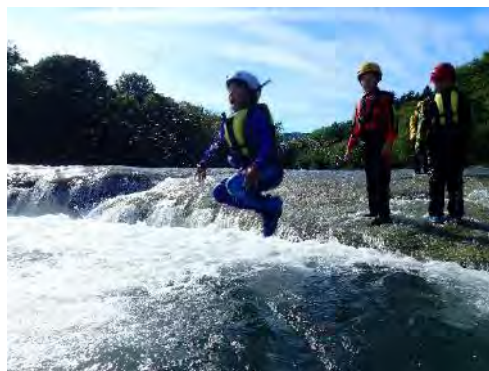
グリーンタフの岩盤と泥団子