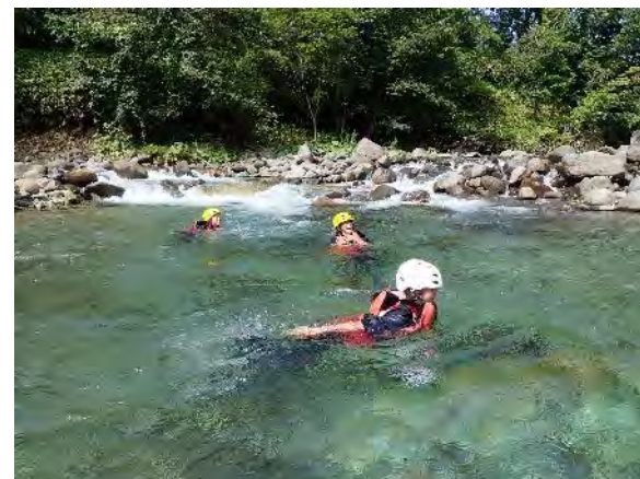
川の出合いは豊富な水量で浮かんで遊べる