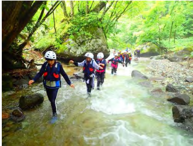
一枚岩の川床がきれいな川を歩きます