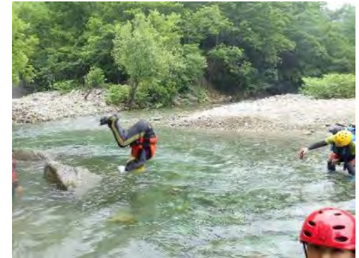
小岩からジャンプ