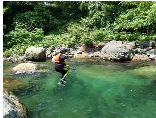
深みへ大ジャンプ