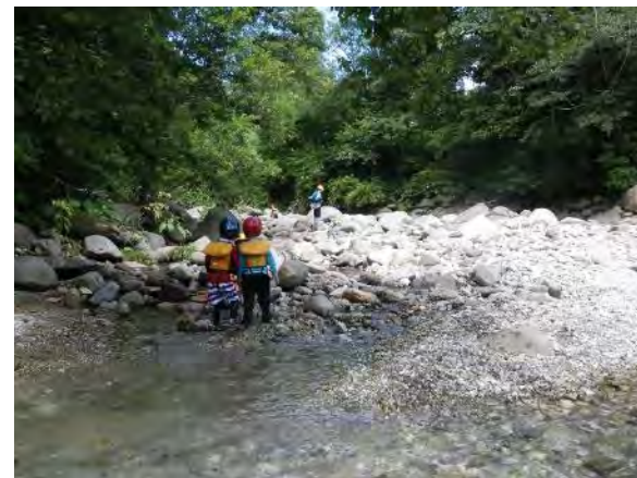
滝ノ沢方面に小さな流れができることがある